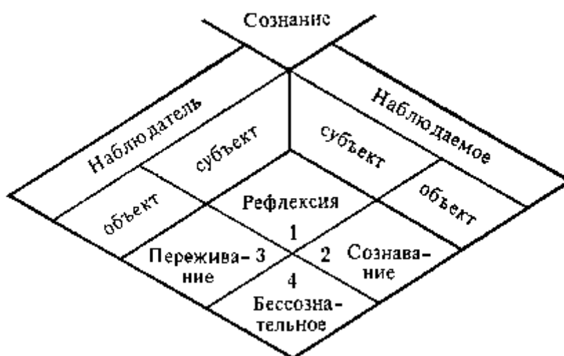
Типология режимов функционирования сознания.

В итоге этого рассуждения мы получаем категориальную типологию, указывающую на место переживания среди других режимов функционирования сознания.