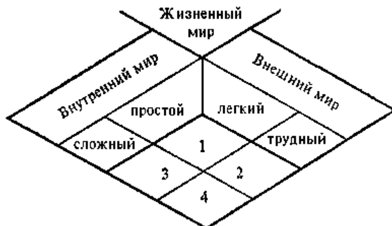
Типология жизненных миров.

Структура этой типологии такова: "жизненный мир" является предметом типологического анализа. Он имеет внешний и внутренний аспекты, обозначенные соответственно как внешний и внутренний мир. Внешний мир может быть легким либо трудным. Внутренний — простым или сложным. Пересечение этих категорий и задает четыре возможных состояния, или типа "жизненного мира".